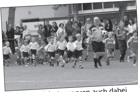
Unsere Kleinsten waren auch dabei